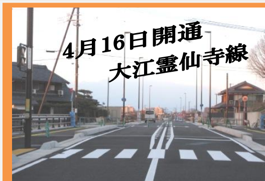
川の下交差点から草津駅上笠線まで一直線!