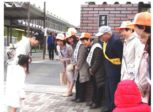
4/9 老上小学校入学式の朝

老上学区まちづくり協議会は、老上小学校区と新設小学校区に分かれて新たに立ち上げることになります。今後、老上学区まちづくり協議会は各種団体と連携・協力して諸課題にスムーズに対応できるよう取り組みます。