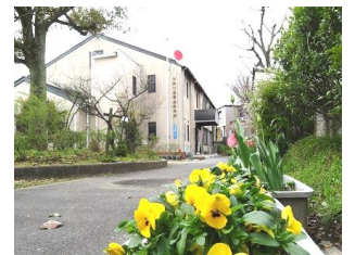
老上市民センター