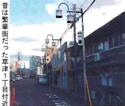
昔は繁華街だった草津1丁目付近

東海道を挟むように二つのお地藏さん。横町地藏と高野地藏です。横町地藏は川の氾濫を守るためにまつられ、お堂の横に階段があります。元々こ