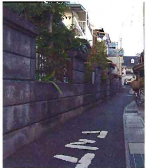
このあたりの路地には名前がついています

本陣小路、本陣横が小川小路：細い路地にまで名前がついているのは、いかに路地と人々の暮らしが結びついていたのかが伺えますね。