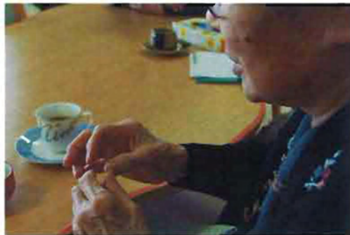
Aさんは92歳。お元気です

たくさん話ができます。利用者もスタッフもなごやかに穏やかな人たちばかり。程よく楽しませてもらっています。花見に連れて行ってもらったり、喫茶店で