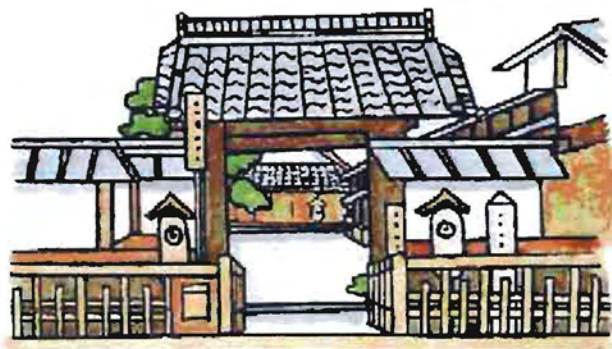
草津宿本陣 Jan 15, 2025

10時~18時 入館無料*23日は休館 連絡問合せ 同館 535-1363 まで