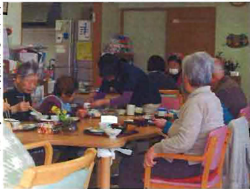
食卓での会話が何よりこちそう

口の体操の傍ら、広く大きな窓のある清潔感あふれるリビングダイニングではスタッフが昼食の準備で忙しく手を動かします。食材はレシビと共に業者から配達されスタッフが調理しま